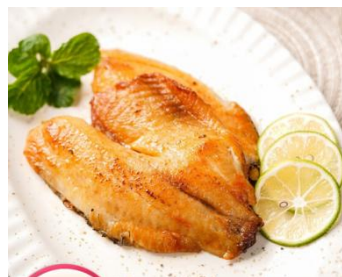
新奥尔良风味鱼排